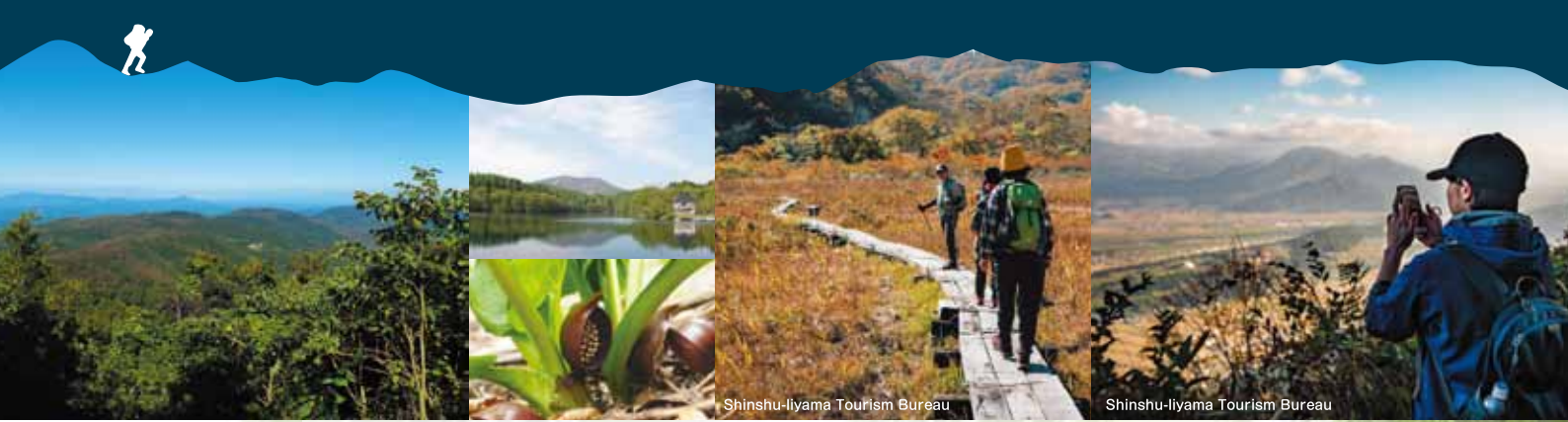
Shinshu-Iiyama Tourism Bureau